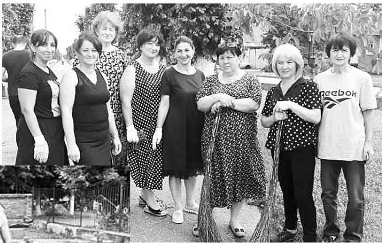
Социалон лæггæдты центры кусджытæ.

Æрыдоны районы цæр-джытæ ивгъуыд сабаты архайдтой æппæт республикон зиуы. Æфснайæн куыстыты фылдæр хай æххæстгонд æрцыд фæлладуадзæн бынæтты, фæн-даггæрæтты. Алыхуызон куыста-дон коллективтæ зæрдиагæй бацархайдтой сæ куысты бы-нæтты алфамблай æрнывыл кæныныл.