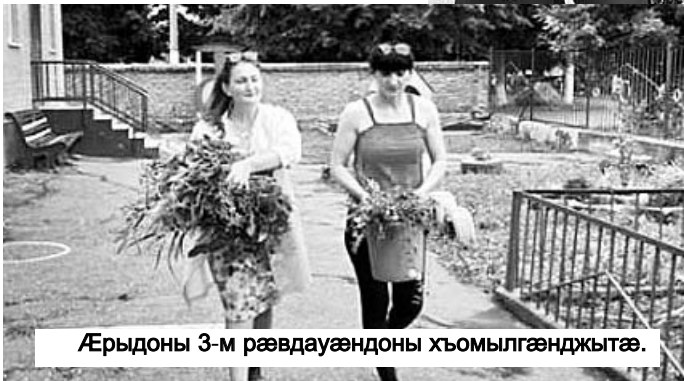
Æрыдоны 3-м рæвдауæндон хъомылгæнджытæ.

Куыд зонæм, афтæмæй 2016 азæй фæстæмæ РЦИ-Аланийы Сæргълæу-уæг Битарты Вячеславы фæндонæй республикон зиутæ цæуынц афæдзы хъарм афон мæйы алы фæстаг сабаты.